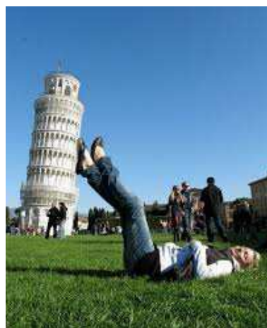
Stolp v Pisi si radi privoščijo na tak način.