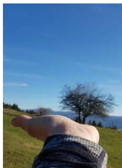
Drevo raste iz roke