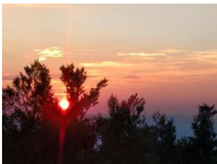
Sonce počiva v krošnji

Kaj od vas pričakujem? Odbite, nenavadne fotografije. Nekaj primerov prilagam, da vam bo jasno, kaj bi rada od vas.