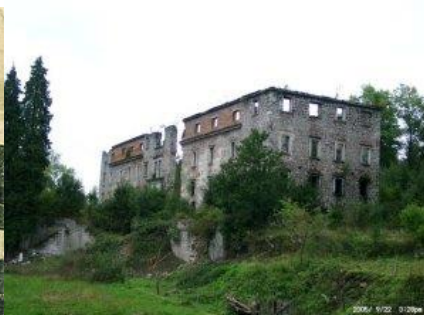
Graščina Haasberg danes

Današnja pot preko Planinskega polja te je pripeljala do ruševin dvorca Hošperk (nemško Haasberg) tudi dvorec Planina, je nekdanji baročni dvorec, katerega ruševine stojijo v bližini Laz oziroma Planine, nad strugo reke Unice. Ruševine dvorca so prekrite z rastlinjem in obraščene z drevjem, stojijo na nasprotni strani kraškega Planinskega polja. Več slik o graščini Haasberg na spodnji povezavi: