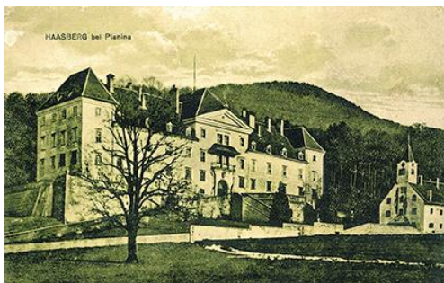
Graščina Haasberg nekoč