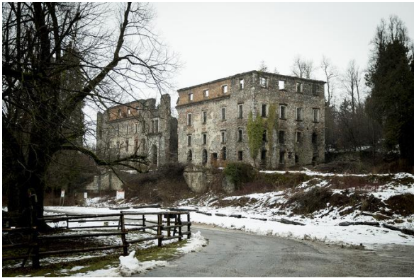
Graščina Haasberg danes

Jeseni 1943 se je v dvorec naselilo poveljstvo nemške vojaške divizije. V grad so vodili ujete partizane in jih pred gradom obešali na drevesa. Nato so te mrtve partizane pometali v ponor Unice. Pred odhodom so ponor zminirali, da bi zakrili sledi teh grozodejstev. To so videli domačini iz Laz. Ko so Nemci odšli, so partizani, Dolomitski odred, da se ne bi Nemci tja ponovno naselili, graščino požgali. To je bilo spomladi 1944.